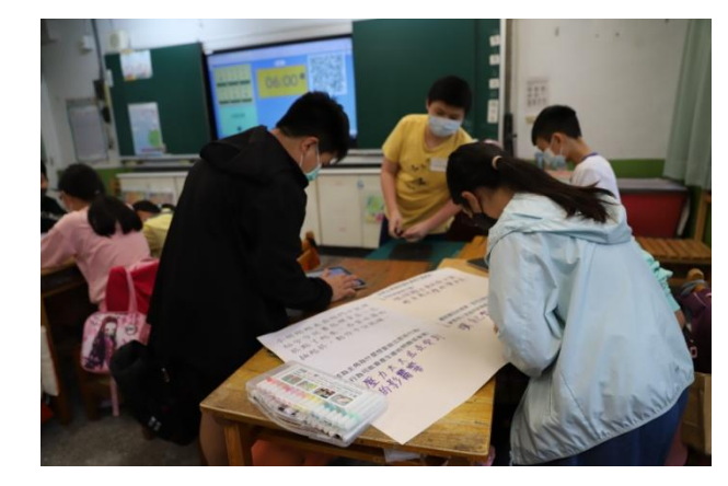
設計生活情境啟發學生思考與討論