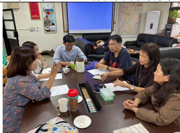
113年3月28日於美華國小共同備課