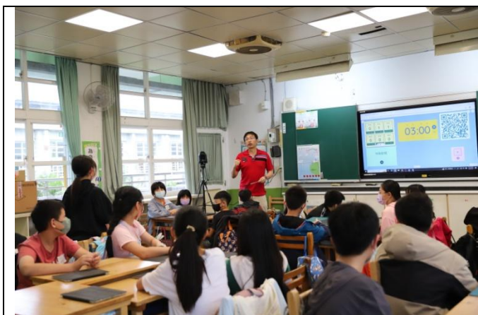
學生大方分享去賣場購物經驗