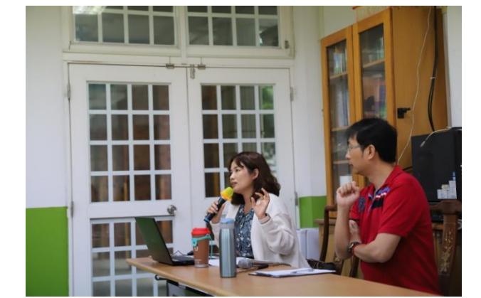
新興國小議課-主持人分享觀課心得