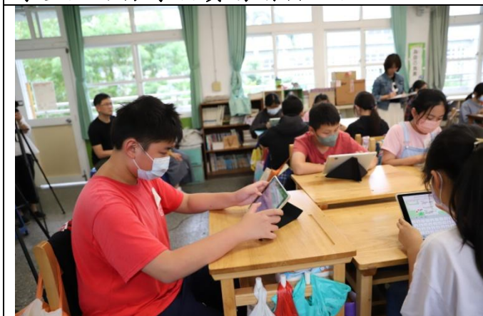
學生運用平板回應教師課堂提問