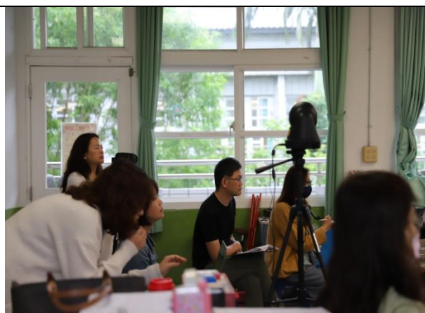
觀課教師專注觀察學生上課情形