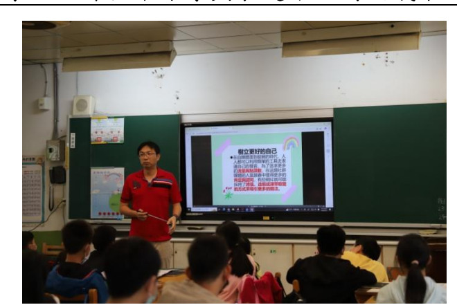
課堂結束前教師歸納總結今日學習重點