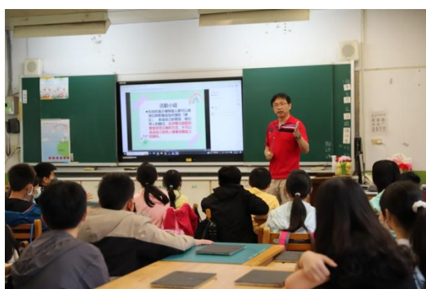
每個活動後教師適時歸納總結學習重點