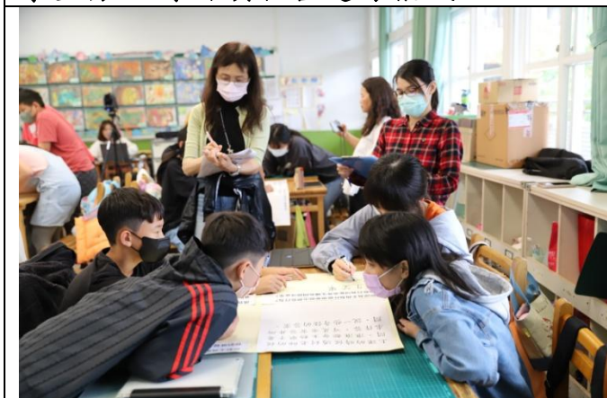
設計生活情境啟發學生思考與討論