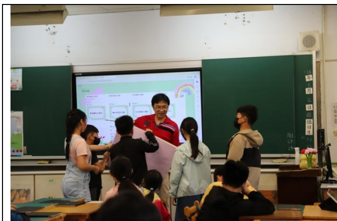
學生分組討論領取答題海報紙