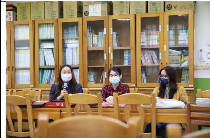
新興國小議課-觀課老師分享觀課心得