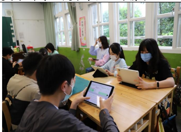
學生運用平板回應教師課堂提問