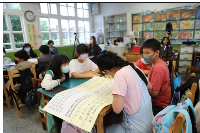
設計生活情境啟發學生思考與討論