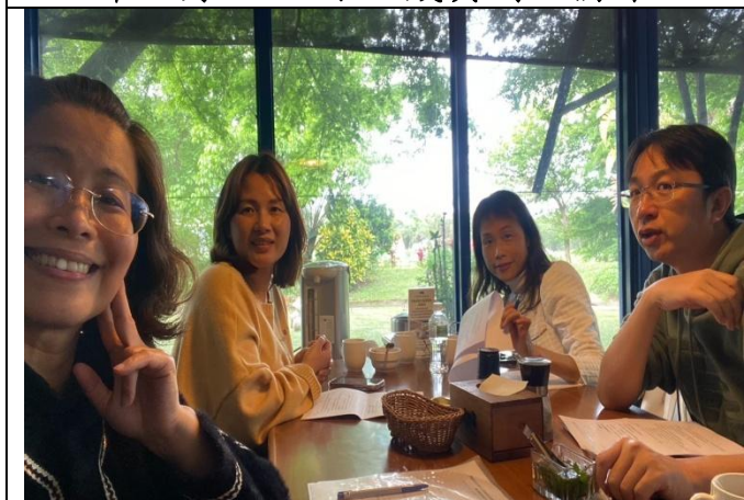
113年3月21日小組成員共同備課