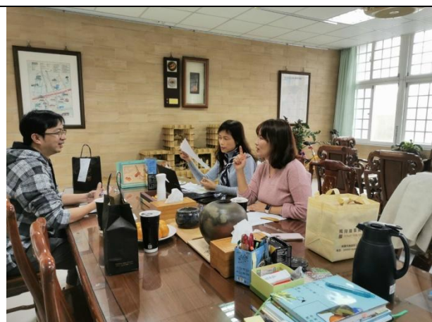
113年3月14日於新興國小共同備課