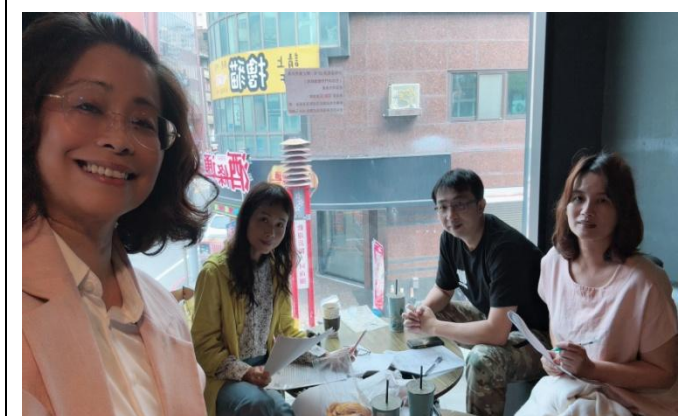
113年4月11日小組成員共同備課