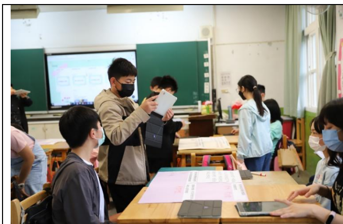
學生將共同討論海報整理後拍照上傳