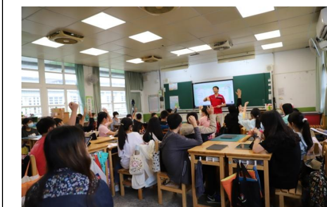
學生專注上課踴躍回應教師提問