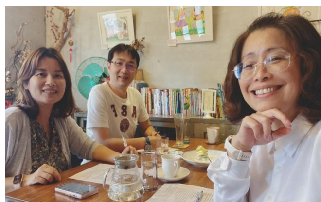
113年4月18日小組成員共同備課