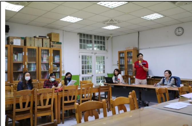
新興國小議課-教學者分享教學心得