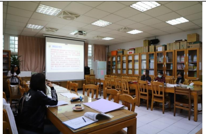
新興國小議課-教學者分享教學理念