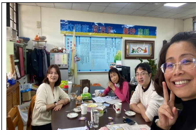
113年2月29日小組成員開始備課