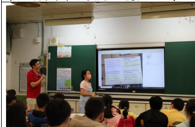
學生於課堂中分享與表達小組討論成果