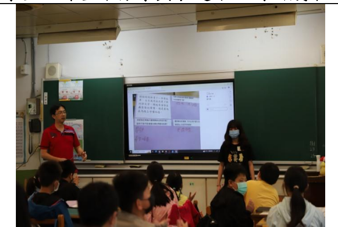
學生於課堂中分享與表達小組討論成果