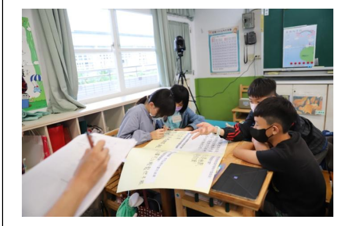
設計生活情境啟發學生思考與討論