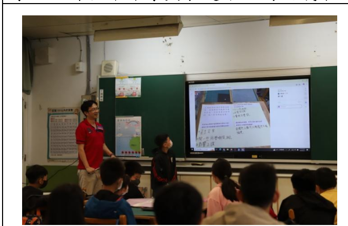
學生於課堂中分享與表達小組討論成果