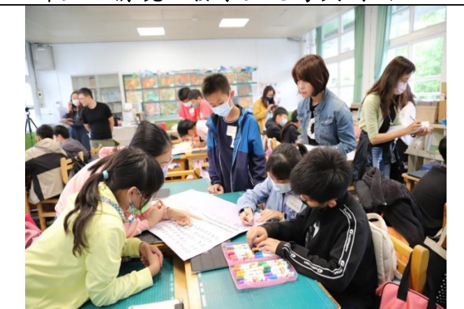
設計生活情境啟發學生思考與討論