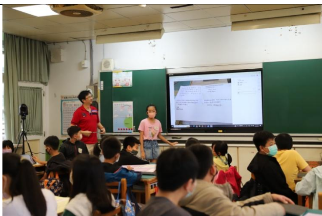
學生於課堂中分享與表達小組討論成果