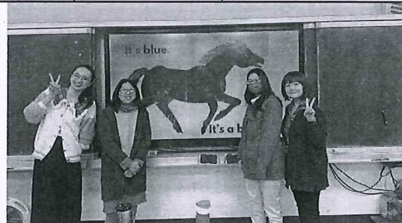
社群成員與 the BLUE Hosre 大合照