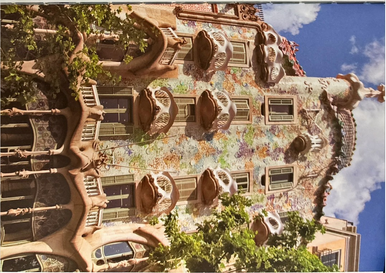
巴特婁之家外牆 安東尼·高第，一九〇五年至 一九〇六年 巴塞隆納

一九〇六年完工後，巴特婁之家獲得了不少綽號。由於外牆的緣故，媒體老愛稱它為骨頭屋或阿欠之家。超現實藝術家薩爾瓦多·達利日後說，這棟「屋子是由靜止的湖水化成的……波光嶙峋，風吹拂水面，泛起陣陣漣漪」。