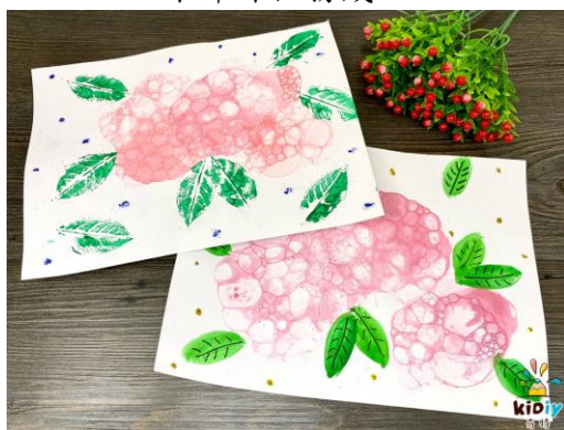
下一節課任務成品

(五)實作評量：教師觀察學童製作的泡泡創作的方法是否有創意，以及是否能依據自己想像中的樣子創作出藝術作品。