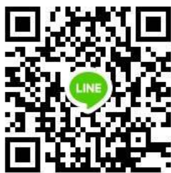
桃園藝文團表演工作坊 line 群組 (桃園市輔導團國小組表演藝術教師群)