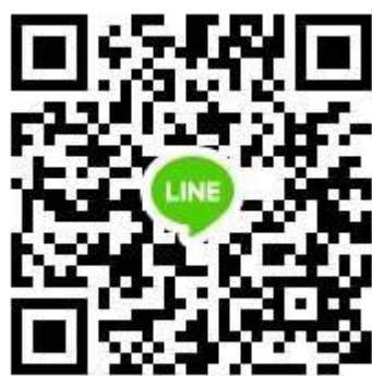
視覺藝術跨校社群 line 群組 (桃園市輔導團國小組視覺藝術教師群)