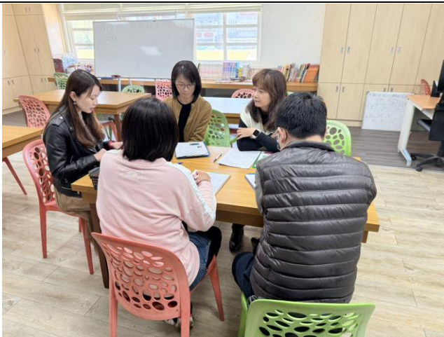
教學者就今日授課說明