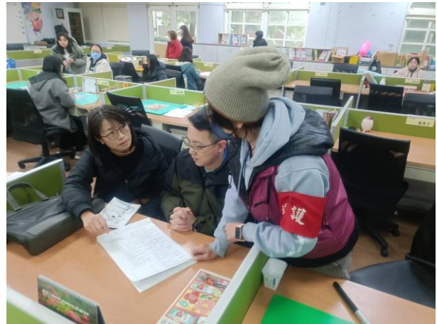
給予建議，需要時間掌控處