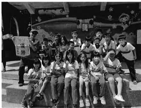
三乙 18 位寶貝