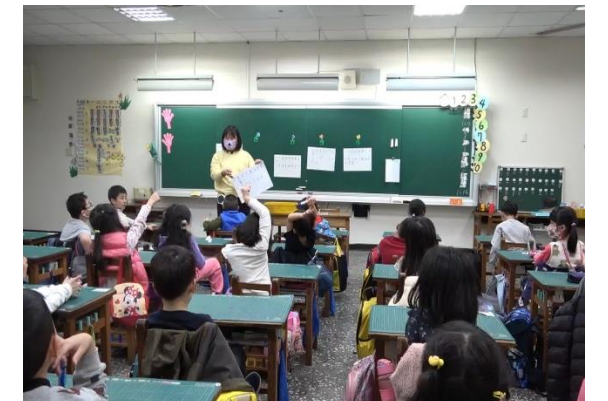
8. 教師說明紀錄的方式，並讓學生開始進行討論