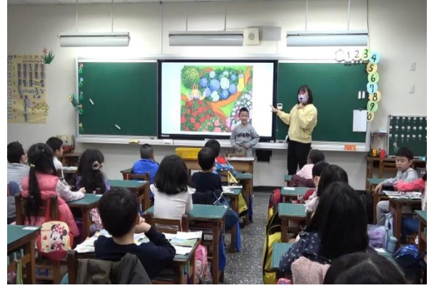
4. 學生上台重述繪本內容