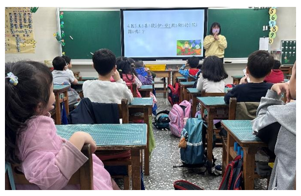
5. 教師透過提問引導學生反思國王的哪個用水習慣是不好的