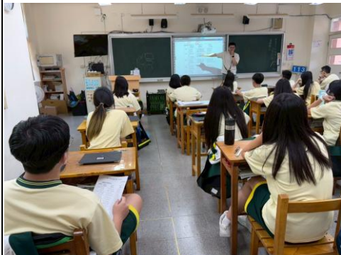
教師說明圖表閱讀策略