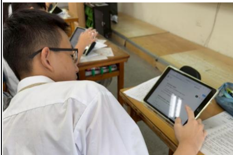
學生使用 ChatGPT 輔助寫作