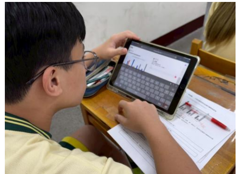
學生用 Padlet 發表對圖表的觀察