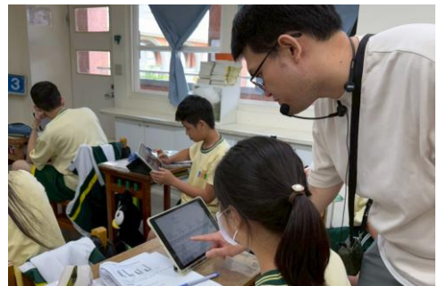
教師協助學生處理 AI 使用的問題