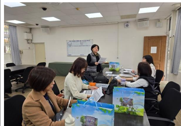
菁華校長主持說課