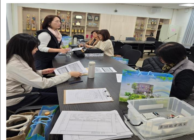
菁華校長邀請綉敏老師分享授課後的想法