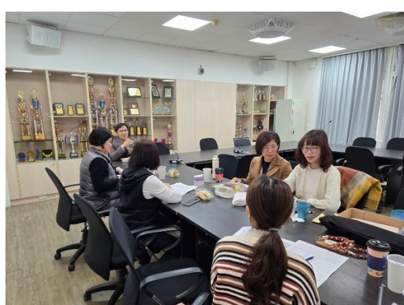
觀課老師們輪流分享心得