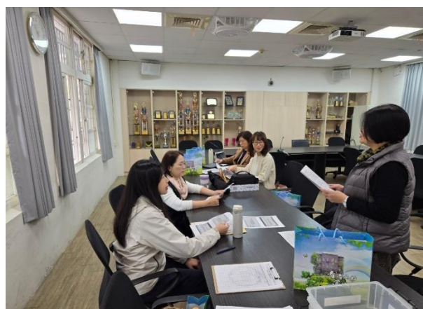
菁華校長主持說課