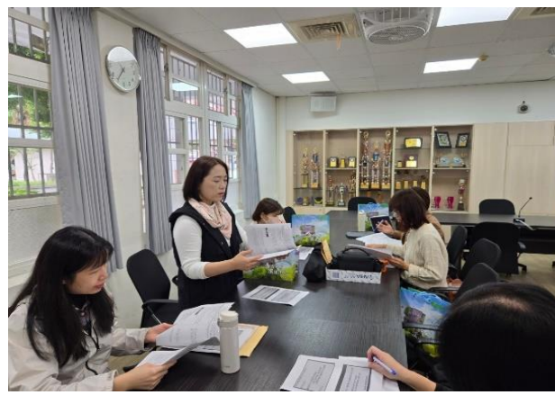
綉敏說明觀課重點